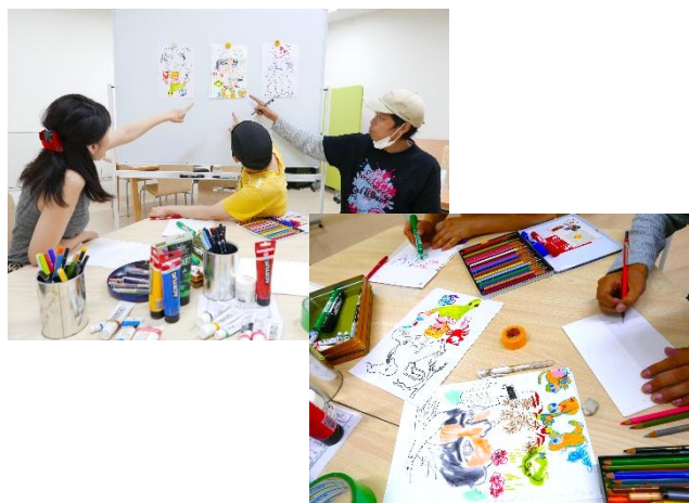
【隣人の日・共創ワークショップ】 (2023年度の事例) 隣人の日・共創ワークショップ