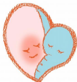
イラスト 石井麻里さん