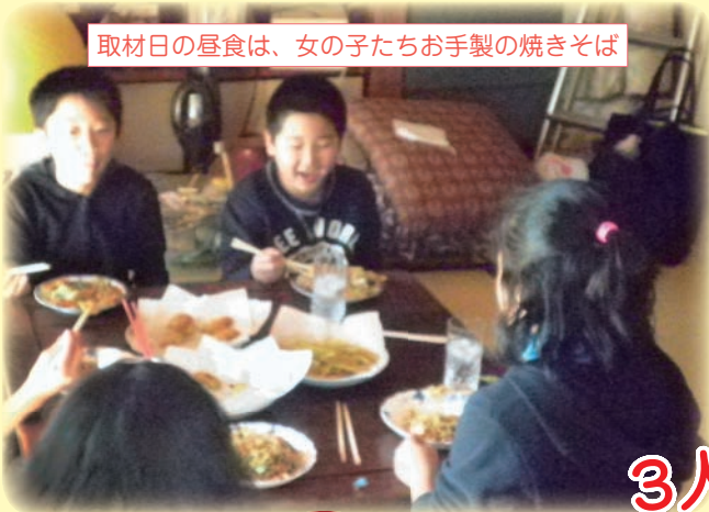
取材日の昼食は、女の子たちお手製の焼きそば