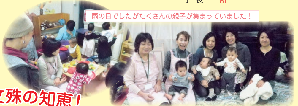
雨の日でしたがたくさんの親子が集まっていました！